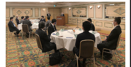
▲写真上は、東地区会、下は、西地区会