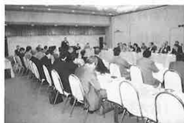
第1回総会のもよう