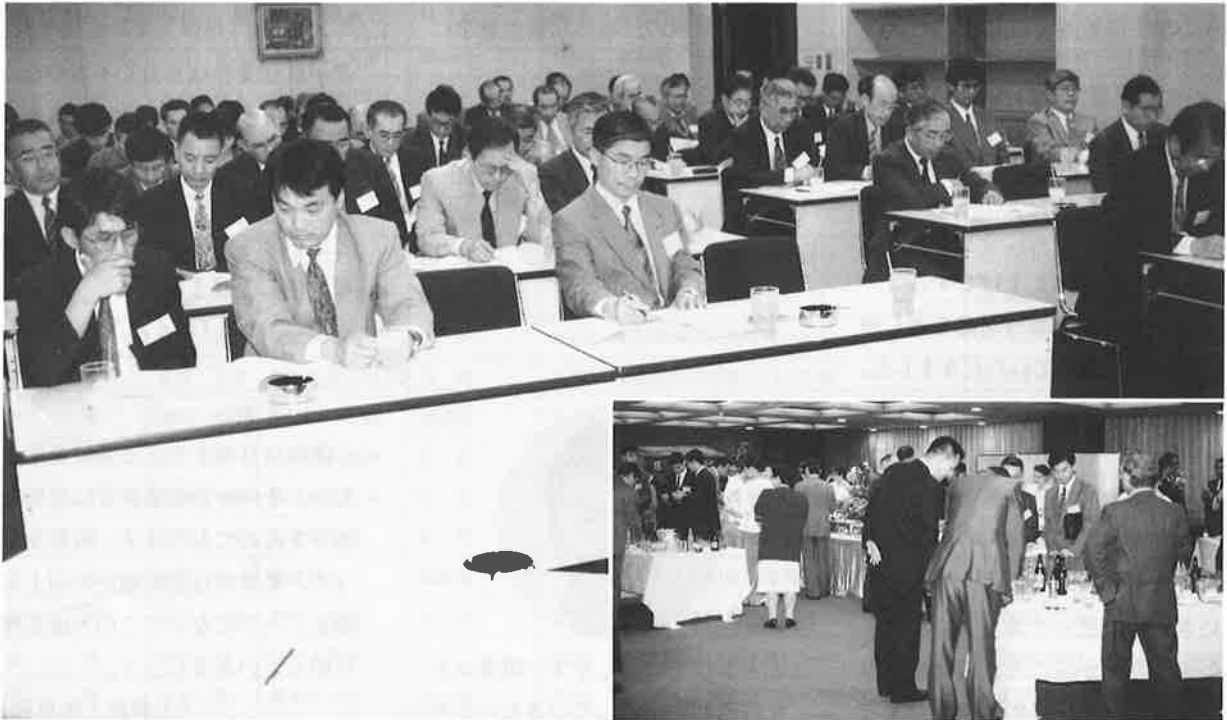
第9回通常総会の会場風景と懇親パーティー（鉄鋼会館）

発行 東京鉄構工業協同組合 〒104 東京都中央区八丁堀3-9-5 KSビル6階 TEL 03 (5566) 1 5 9 5 FAX 03 (5566) 1 5 9 7